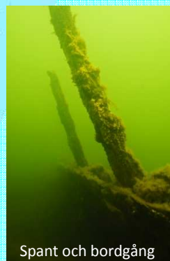
Spant och bordgång