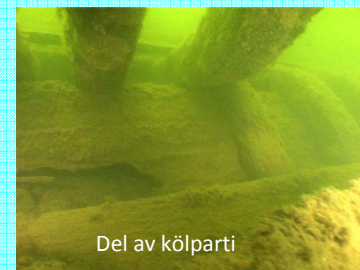
Del av kölparti

3. Köl och skrov. Eftersom delar av skrovsidan brutits loss får man här ett tydligt tvärsnitt som visar hur skutan byggts – med köl, bottenstockar, bordläggning och innergarnering.